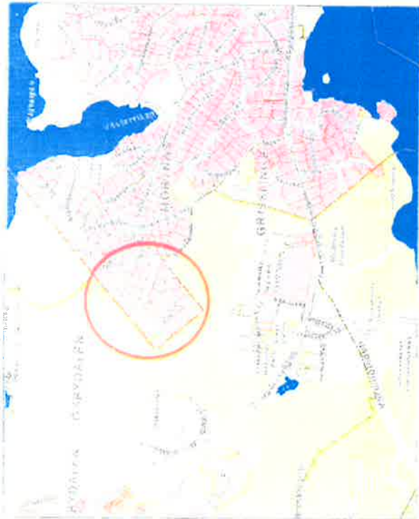
GSD fastighetskartan M 2001-5375

Syftet med tillägget är att anpassa planområdena för permanentboende genom att utöka byggrätten och medge byggande i två våningar i samband med detta kommunal vatten och avlopp att bygges ut till samliga fastigheter inom området