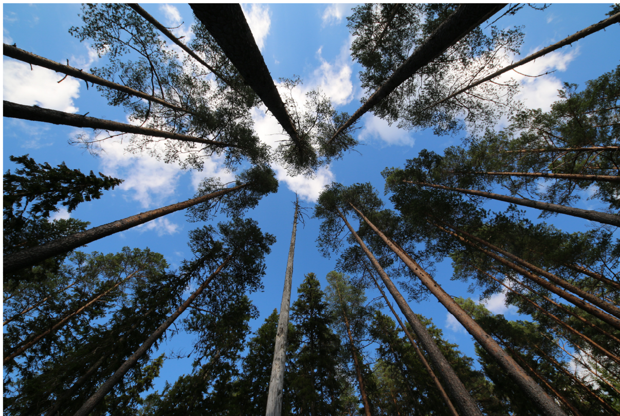
Bilden ej från objektet