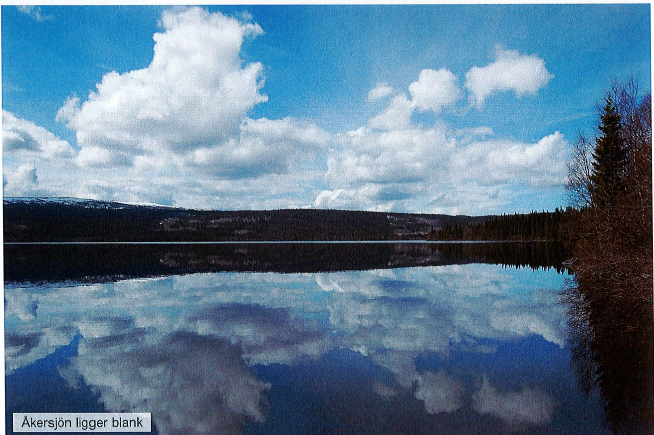
Åkersjön ligger blank