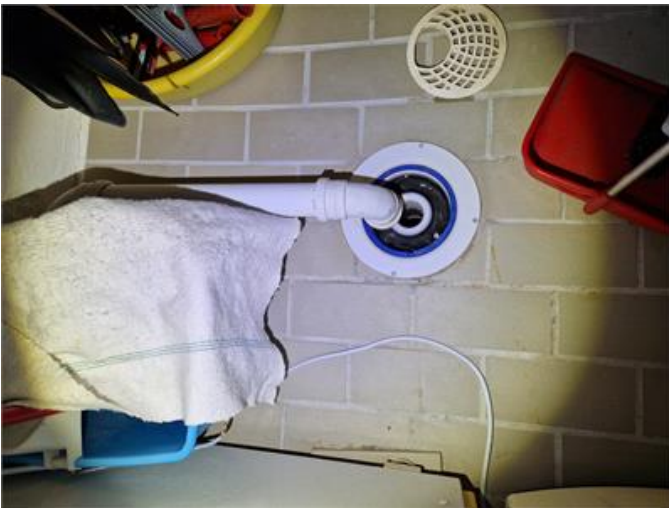
Tvättstuga: Golvbrunn bedöms vara bytt efter att klinkergolv lades.