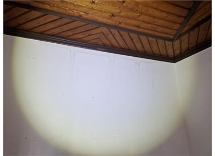
Lägenhet 2, Sovrum 2: Fuktfläckar förekommer på vägg