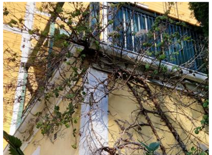
Fasad/Sockel: Vegetation förekommer invid fasad/husgrund