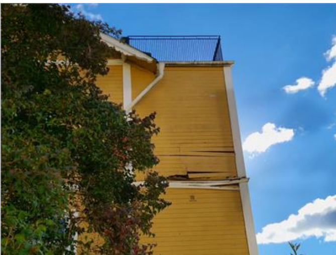
Fasad: Fuktskador noterades i fasad.