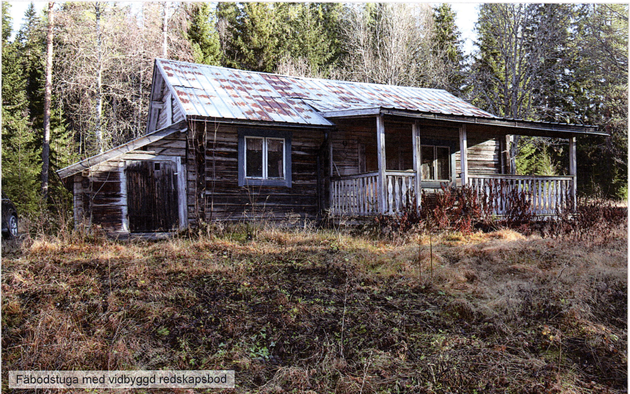
Fäbodstuga med vidbyggd redskapsbod