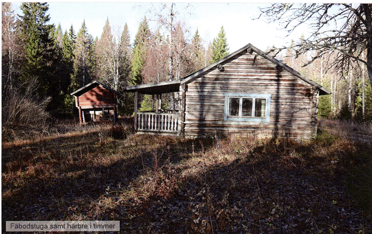
Fäbodstuga samt härbre i timmer