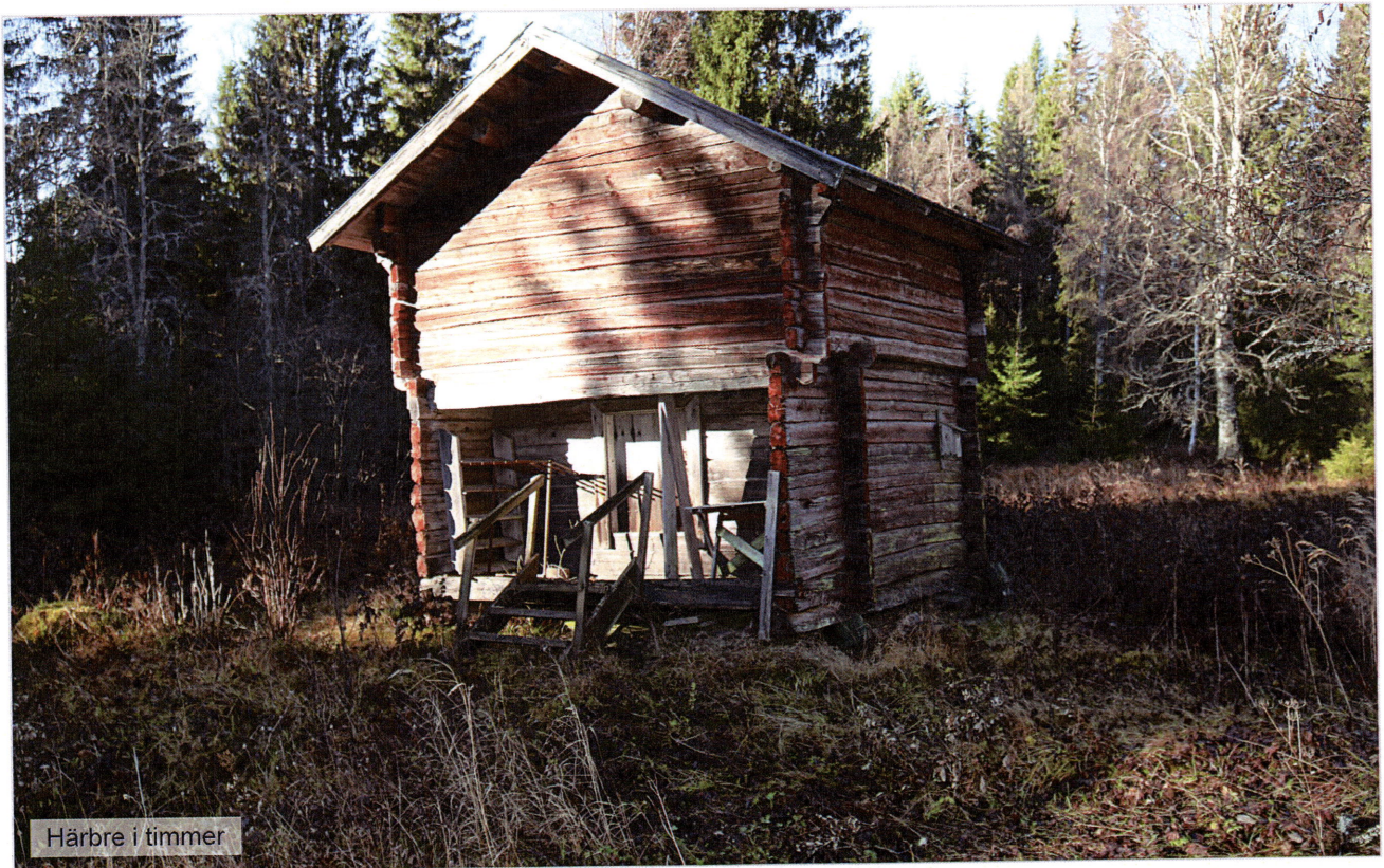
Häbre i timmer